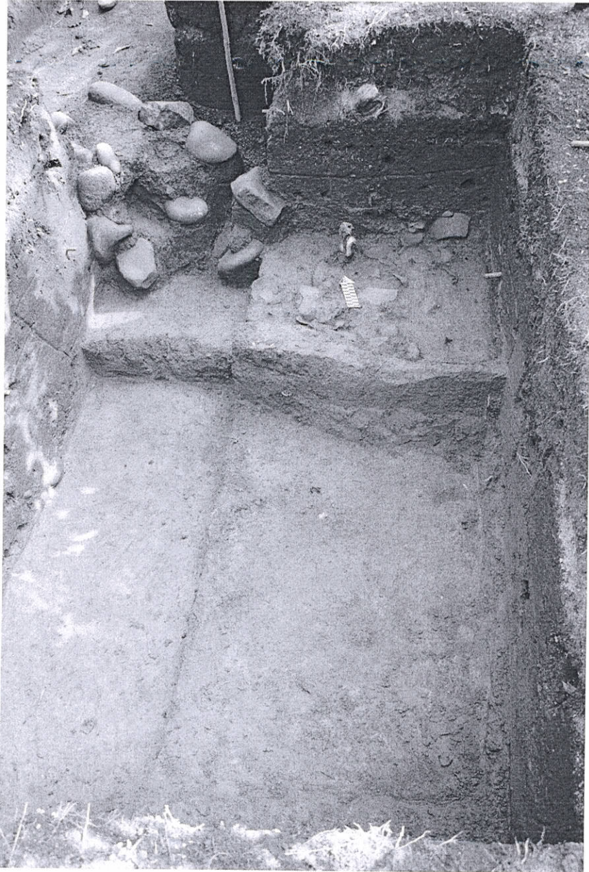
Figura 3. Fotografía de la Planta III de la Ofrenda BB4bse/6C (Parque Arqueológico Nacional Tak'alik Ab'aj, MICUDE, DGPCN/IDAEH 2019).

Vo.Bo. ARQUEÓLOGO Miguel Orrego Corzo JEFE ADMINISTRATIVO PARQUE ARQUEOLÓGICO TAKALIK AB'AJ